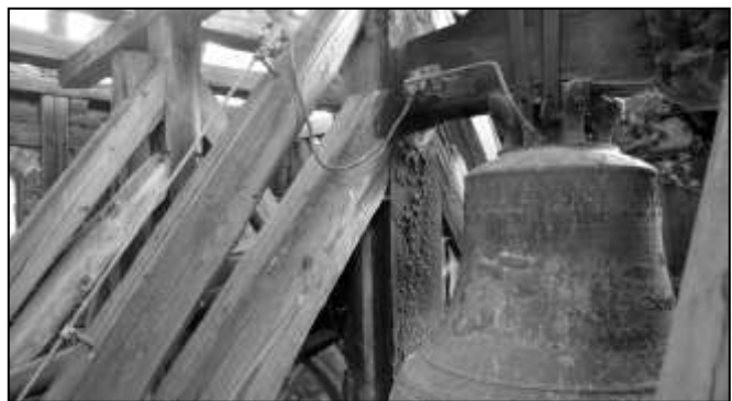
Kirchenglocke im Kirchturm